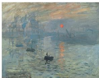
Klod Mone Taassurot. Ko'tarilgan quyosh. 1872. Marmottan-Monet Muzevi, Parij

Yevropa impressionistlarining «yorug'lik va rang» nazariyasi O'zbekiston tabiati uchun juda mos keldi. Pavel Benkov ijodida biz yevropacha impressionistik uslubning sharqona hayot tarzi bilan uyg'unligini ko'ramiz. Uning asarlaridagi hovuz bo'yidagi choyxonalar, keksa nuroniylar va yorqin kiyimlar impressionizmning «lahzani muhrlash» tamoyiliga tayanadi.