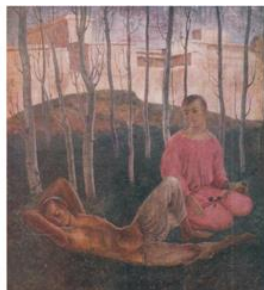
Nikolayev Aleksandr. Bahor. 1923

Xulosa. Yevropa badiiy maktablari O'zbekiston san'ati uchun «begona» emas, balki uning zamonaviy qiyofasini yaratishda katalizator vazifasini o'tadi. Agar Yevropaning ratsional texnikasi va Sharqning emotsional-dekorativ kuchi