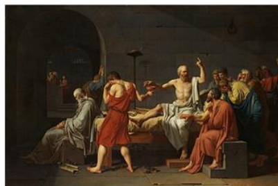
Sokratning O'limi. 1787

Davidning shogirdi J.O. Engr Akademizmning so'nggi buyuk ustasi edi. U chiziqning mutlaqligini himoya qilib, rangga urg'u beruvchi Romantiklar bilan umrbod kurashdi. Biroq, XIX asrning ikkinchi yarmi sanoat va ilm-fan rivoji davrida bu qat'iy qoidalar hayotdan uzilib qoldi. Klassitsizm va Akademizm Yevropa san'atiga yuksak texnik mahorat va kompozitsiya qoidalarini meros qoldirdi. Biroq, ularning «ideal go'zallik»ka o'ta yopishib qolishi san'atning erkin rivojlanishiga to'sqinlik qila boshladi. Bu esa XIX asr oxiridagi «San'at inqilobi» uchun zaruriy turtki bo'ldi.