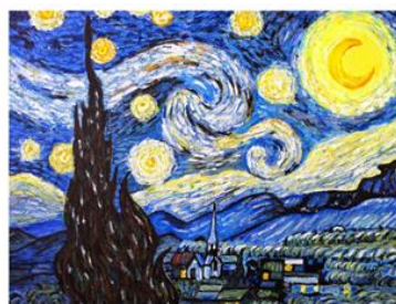
Vinsent Van Gog "Yulduzli tun". 1889. Zamonaviy san'at muzevi, Nyu-York Shahri

1880-yillarning oxiriga kelib esa, ba'zi rassomlar impressionizmning «o'ta yumshoqligi» va shaklning yo'qolib borishidan norozi bo'la boshladilar. Ular san'atga chuqur mazmun va qat'iy strukturani qaytarishni xohladilar va bunga erishdilar. Bunga misol qilib quyidagi rassomlarni ko'rib chiqishimiz mumkin. Vinsent van Gog rangni borliqni tasvirlash uchun emas, balki o'zining ichki iztirobi va hayajonini ko'rsatish uchun ishlatdi. «Yulduzli tun» asaridagi burama chiziqlar va qalin bo'yoq qatlami uning ruhiy holatidan darak beradi.