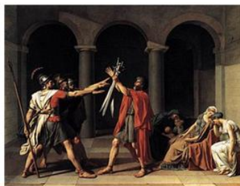
Horace Qasamyodi. 1784. Luvr, Parij

Fransuz rassomi Jak-Lui David ushbu maktabning eng yirik namoyandasi hisoblanadi. Uning asarlari, xususan, «Horatiylarning qasamyodi» va «Sokratning o'limi», san'atda erkaklik g'ururi, vatanga sadoqat va qat'iyat timsoliga aylandi. Kompozitsiyon jihatidan Davidning asarlarida sahna teatrdagi kabi aniq bo'lingan, fon esa ikkinchi darajali bo'lib, asosiy e'tibor haykalmonand shakllarga qaratilgan.